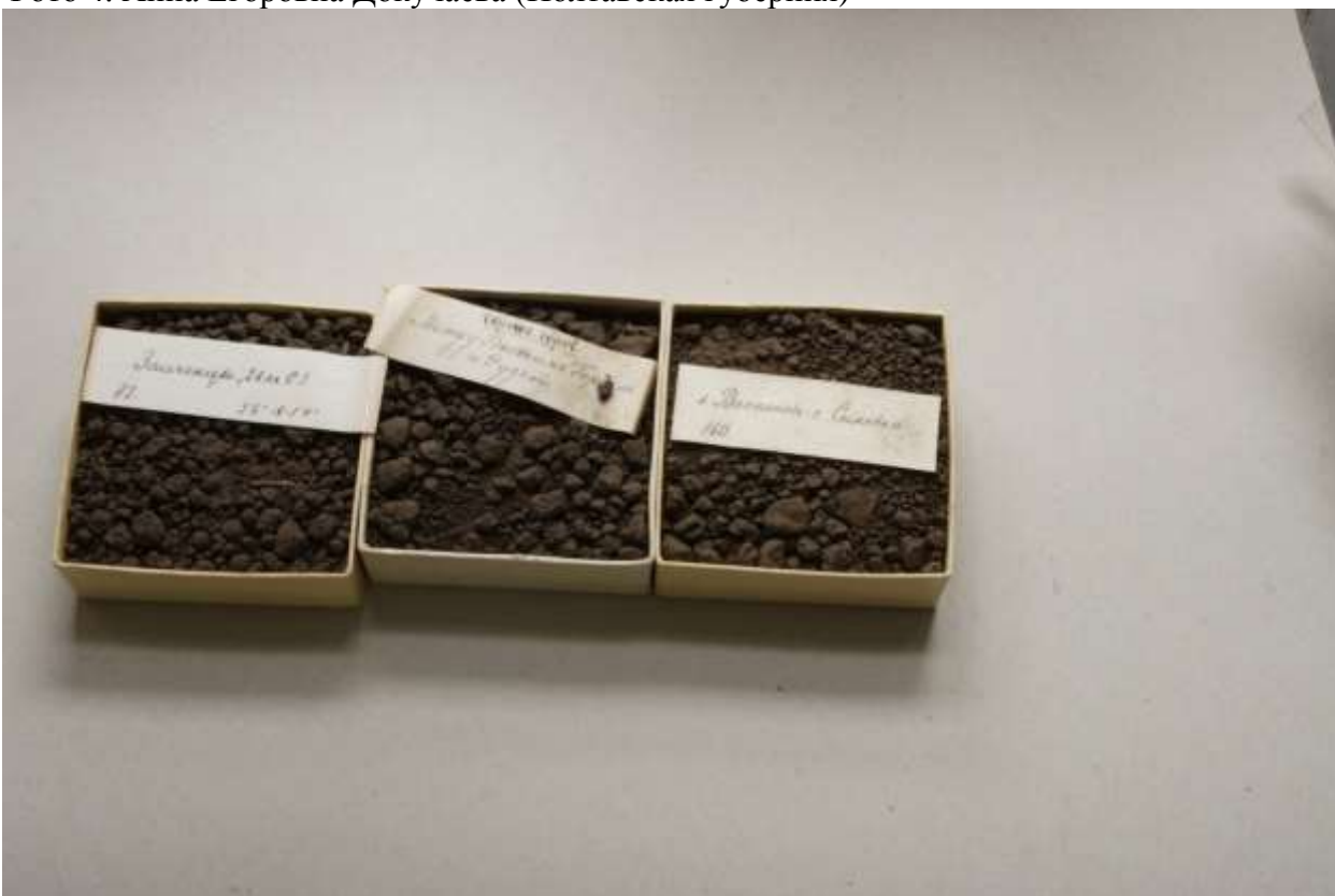
Фото 5. Почвенные образцы В.В. Докучаева (Полтавская Губерния)