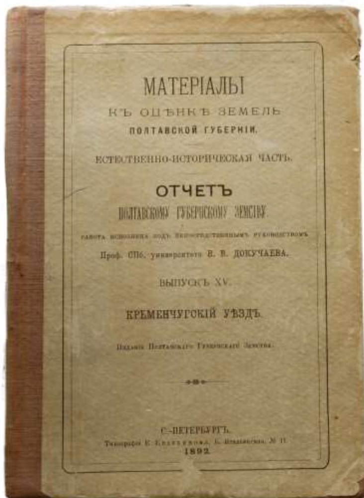
Фото 2. Полевой журнал экспедиции В.В. Докучаева со списками образцов горных пород, почв и материнских пород, составленный по уездам Полтавской губернии участниками экспедиции