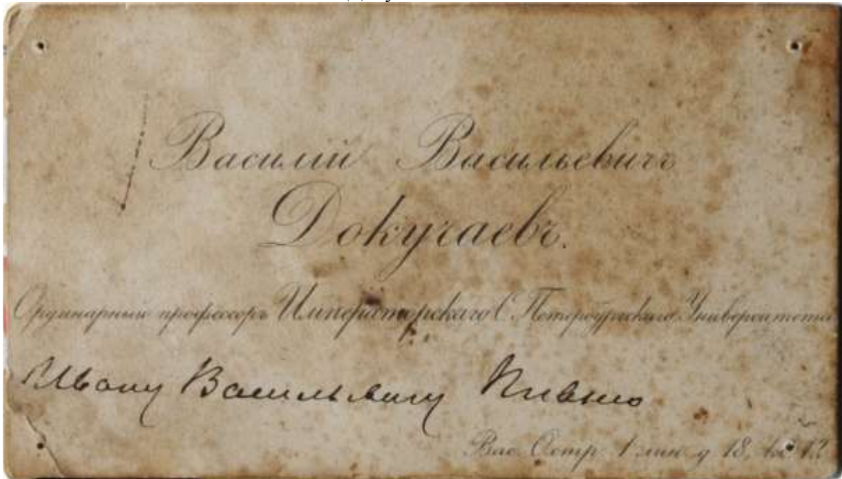
Фото 8. Визитка Василия Васильевича Докучаева