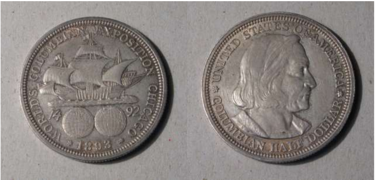
Фото 9. Памятный денежный знак, выпущенный к началу всемирной Выставки Чикаго 1893, на этой выставке была представлена коллекция почв Докучаева