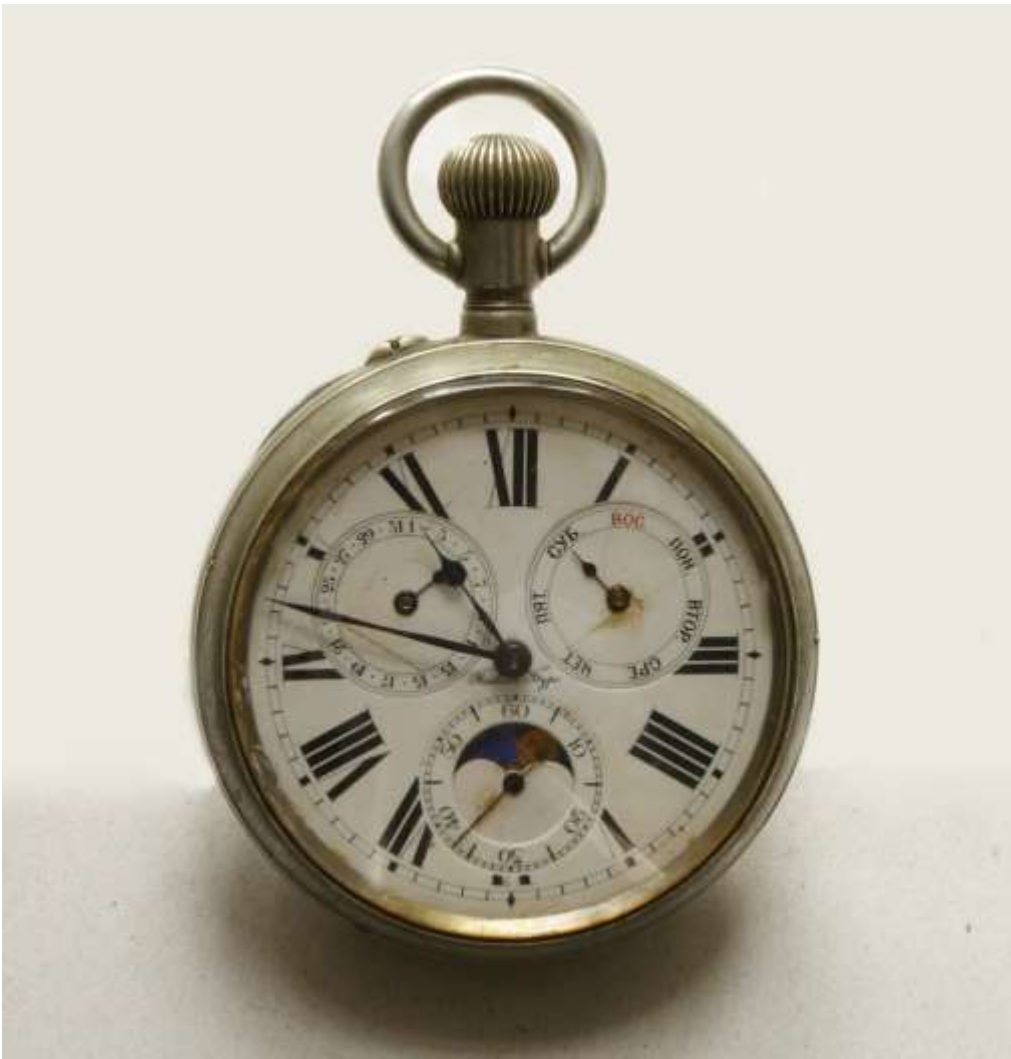
Фото 7. Часы Василия Васильевича Докучаева