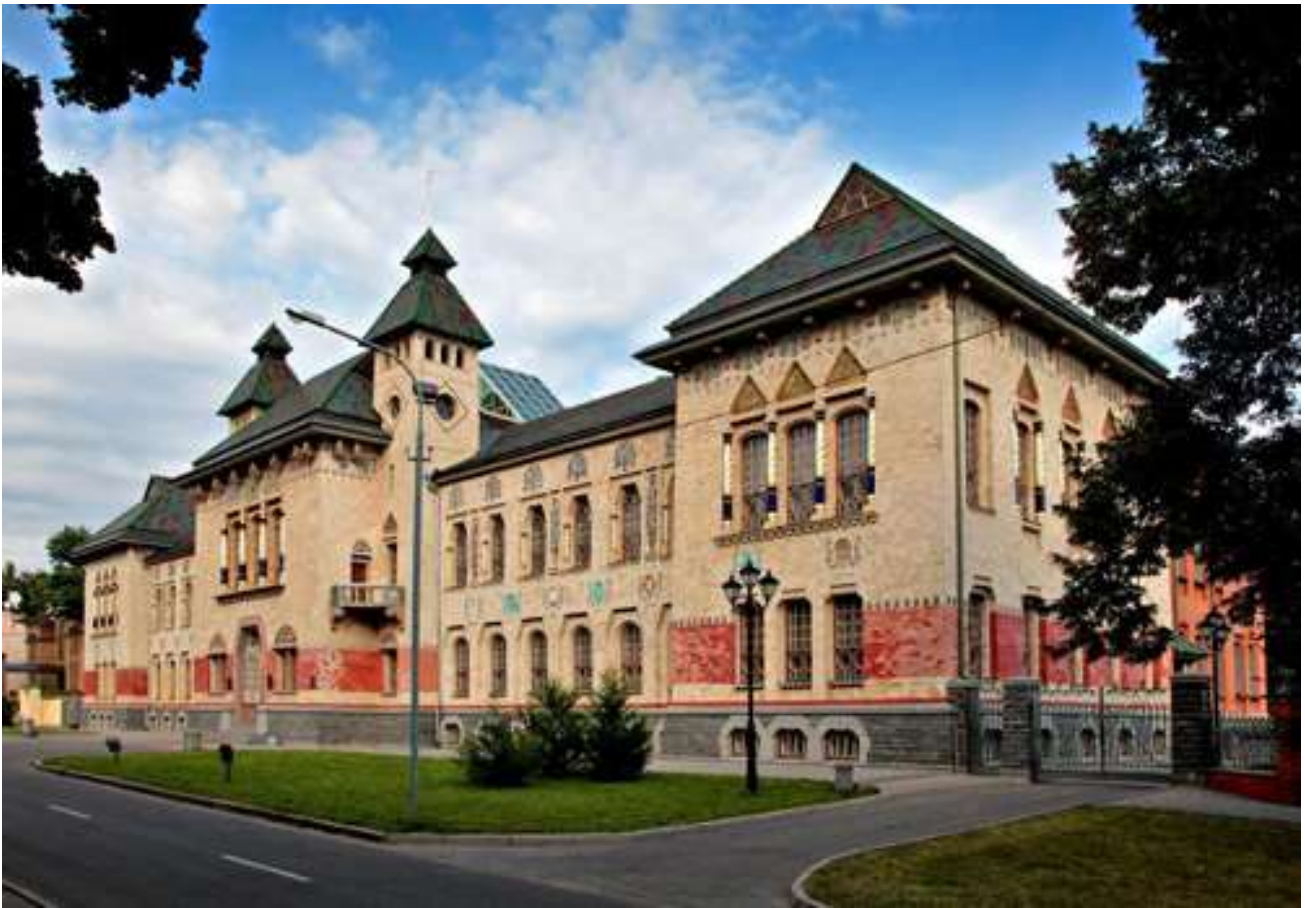
Фото 1. Полтавский краеведческий музей имени Василия Кричевского - памятник архитектуры национального значения