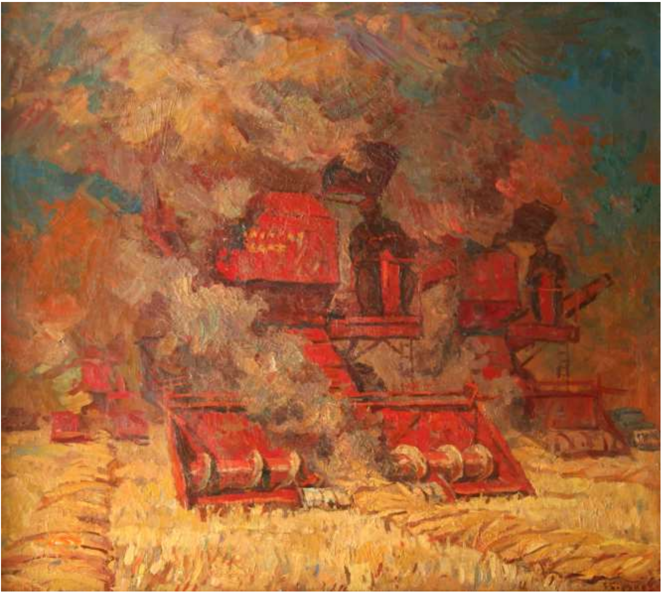
Рис. 3. Битва за хлеб. (Борунов Г.Ф.) Холст, масло. 102x114,5 Собственность ГХМАК.