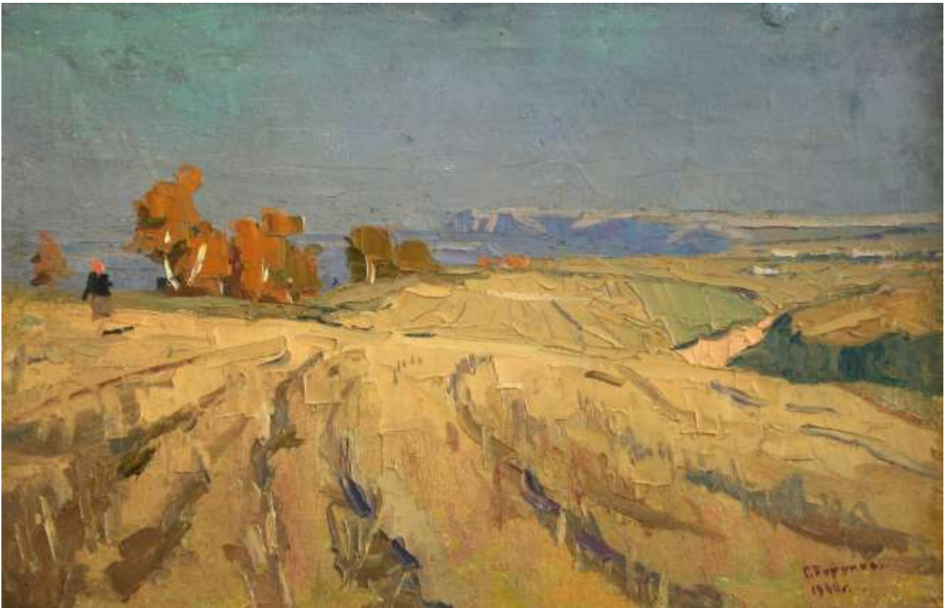
Рис. 2. Бабье лето 1964–1967гг. (Борунов Г.Ф.) Холст, масло. 206х188 Собственность ГХМАК.